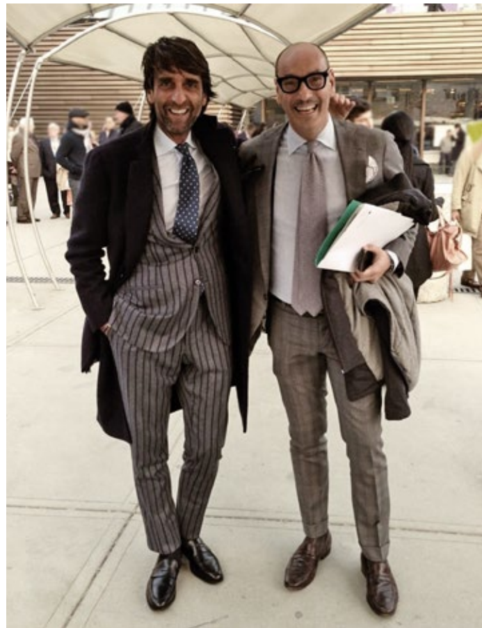
FIRENZE . Pitti Immagine Uomo Gennaio '13