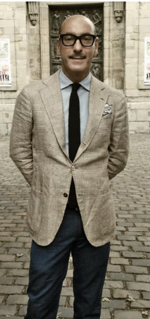
PARIGI . Premiere Vision