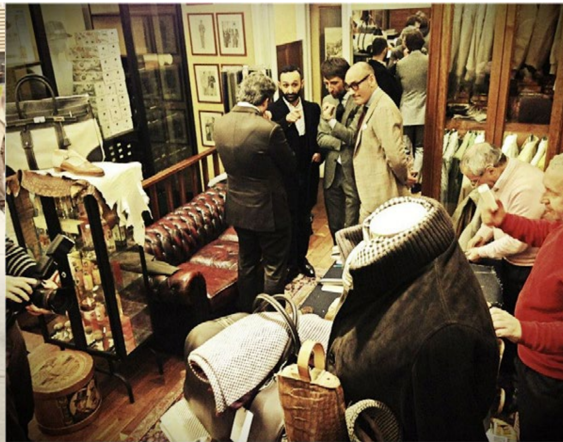
ROMA . Bespoke Tour